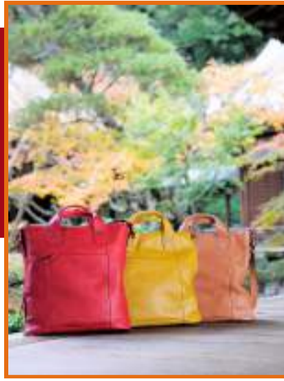
“Corteo Riga mini” Italian semivegetable Leather Bag / コルテオ Riga mini イタリアン セミベジタブル バッグ