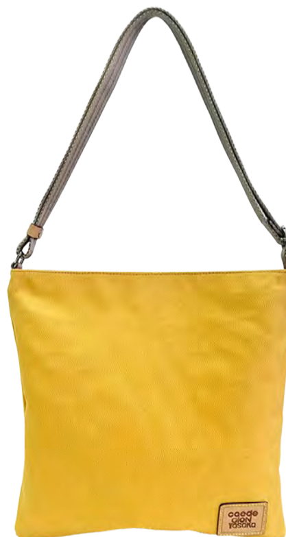
イタリアン/ヘンプ&コットン