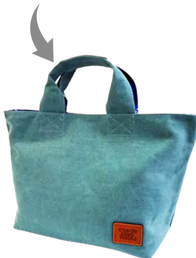
イタリアン/ヘンプ&コットン

オープンポケットに加え、ファスナーポケットも装備。内面ではインナーポケットとしても使用できる設計。