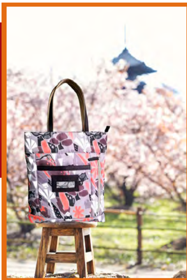
“Maiko Puzzule Etna” TOTE BAG / 舞妓パズル エтна トートバッグ