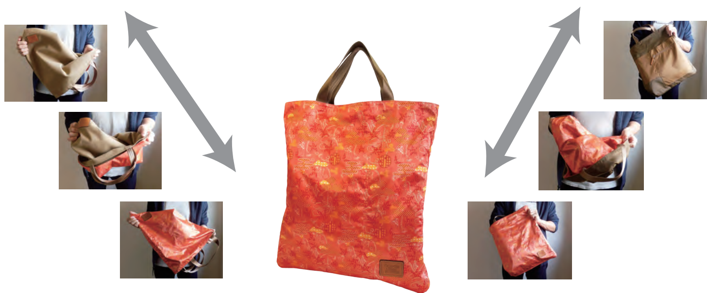
Maiko Garden (サテンプリント)