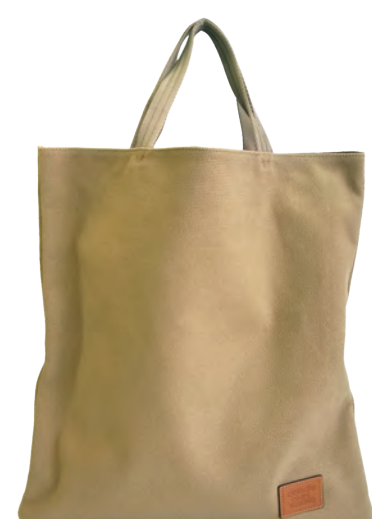
Milanoキャンバス(特殊帆布)

イタリアで初めて開発した、10本撚りの特殊帆布をメインフェイスに使った「3フェイス」に変化するトートバッグ。丈夫で存在感のある「キャンバス」、京都の舞妓や風景をモチーフにした「サテンプリント」、高密度に織り上げられた「コンビネーションナイロン」3つの表情が楽しめる、3チェンジバッグ。