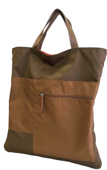
カラーコンビネーションナイロン