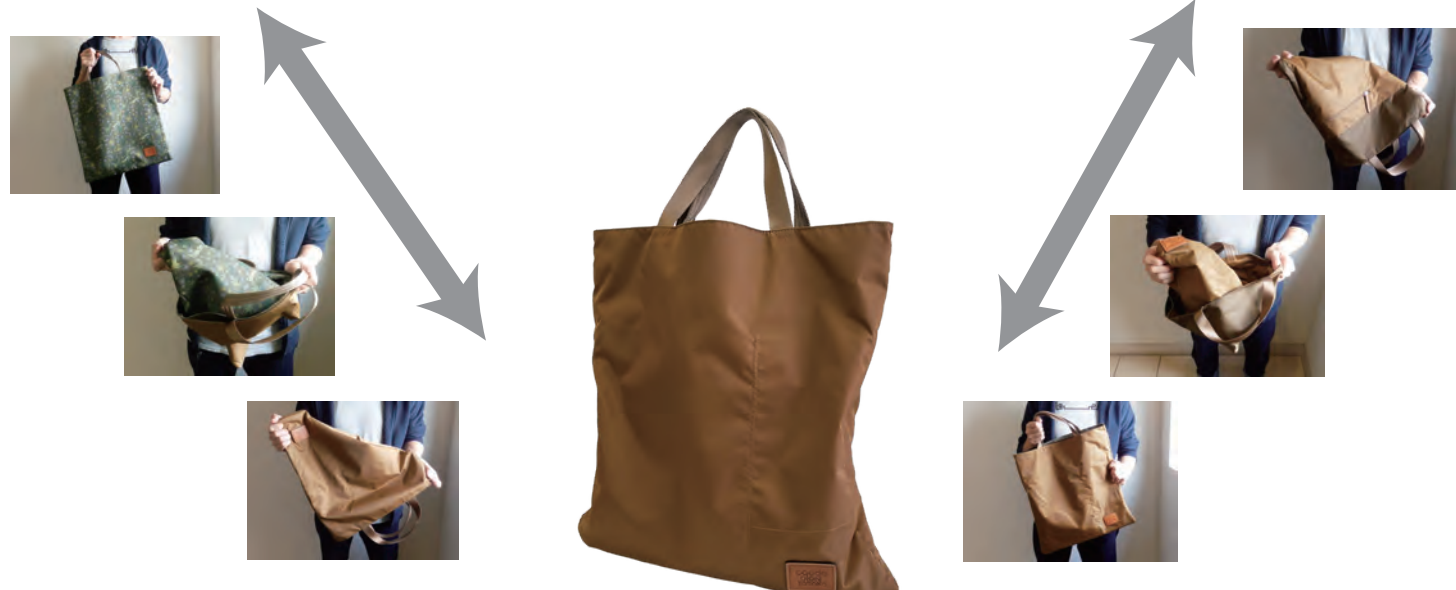
高密度撥水ナイロン

【Material=1】 Stella leaf print Nylon canvas /