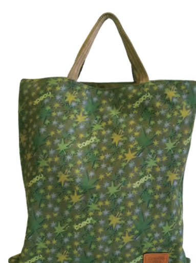
ステラ(星柄)リーフプリント

[ステラ(星柄)リーフプリント][高密度撥水ナイロン][コンビネーションカラーナイロン]の3フェイスに変わる、3異なる顔が楽しめるデザイン。