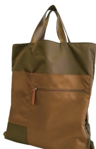
カラーコンビネーションナイロン